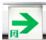
白色：非常口の方向