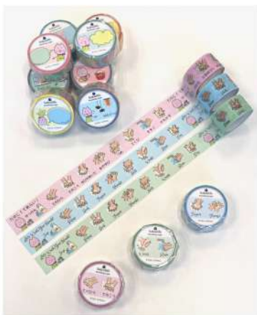
手洗いの手順のマステを含めた3種類をお届け！