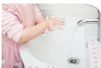
Wash Your Hands!