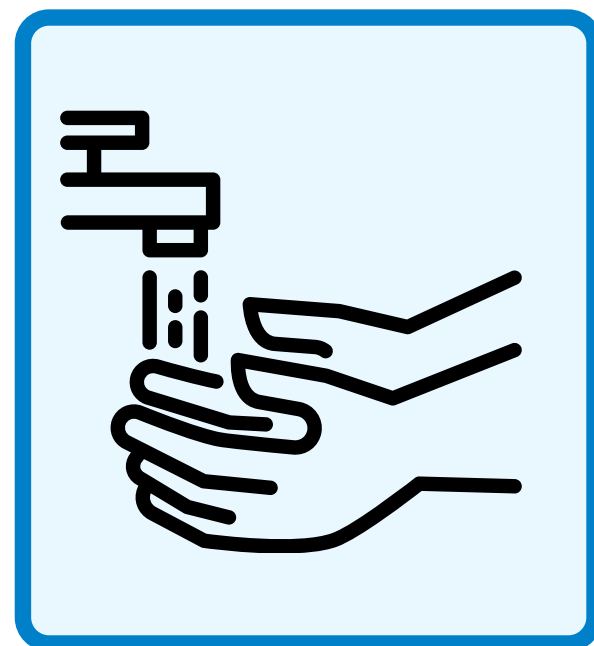
しっかりとすすぎましょう Rinse thoroughly.