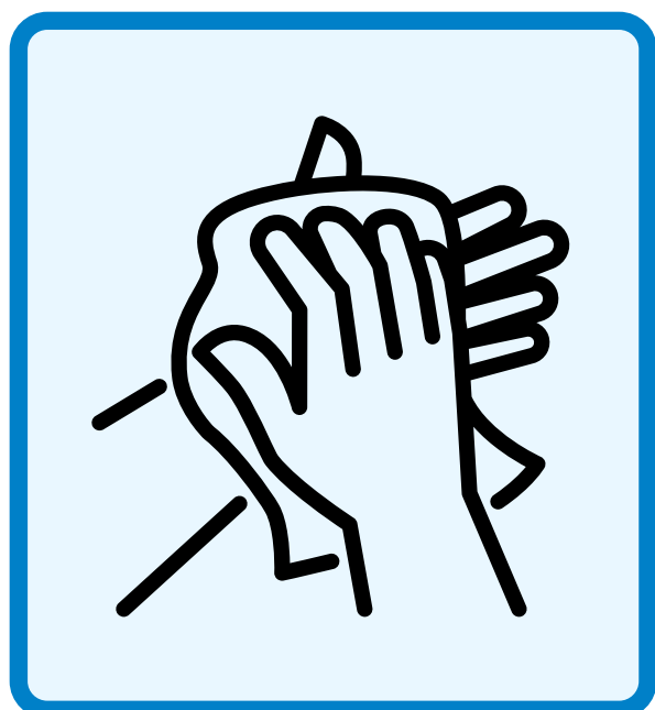
手洗いの後は清潔なタオルで 乾燥しましょう Use a clean towel to dry your hands.