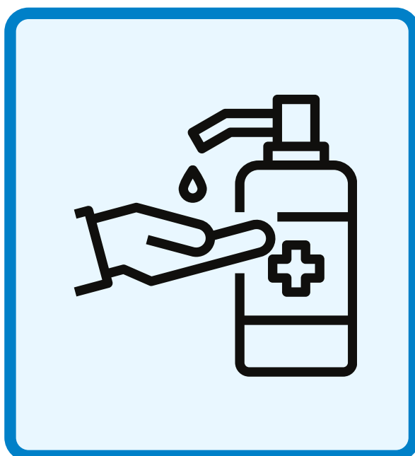
乾いた手で 消毒しましょう Disinfect with dry hands.