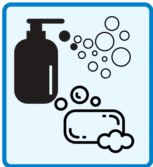
石けんで洗いましょう Wash with soap.

Wash your hands properly for prevention.