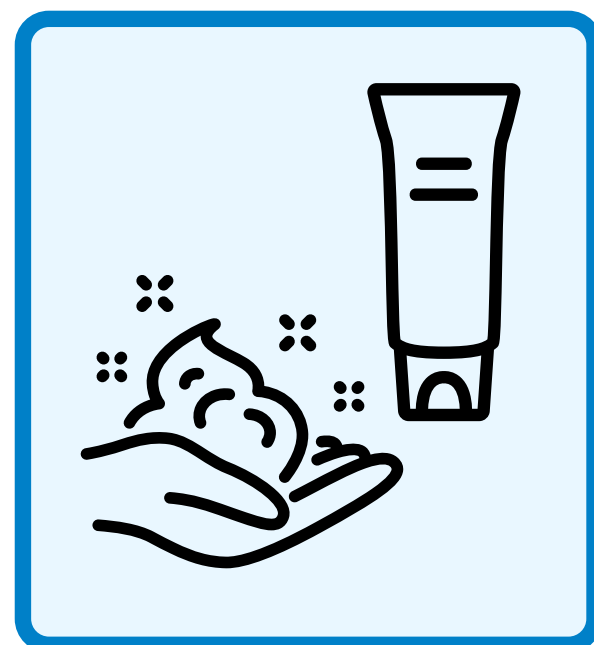
ハンドケアをしましょう Treat your hands.