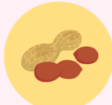
らっかせい (ピーナッツ)