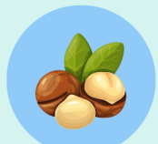
マカダミアナッツ